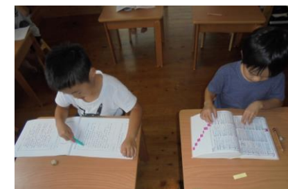
年長になると少しずつ自学できるようになります