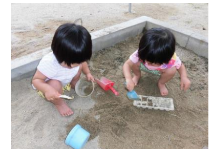
2歳の砂遊び。黙々と同じことを繰り返します

そろばんや学習、体操、音楽の取り組みについては個人差もありますが、毎日少しずつの積み重ねでどの子も必ず身につけていきます。「できた！」を体験することは達成感と同時に大きな自信となって更に伸びる力を育てます。これは焦って無理やりさせても決してできるものではありません。